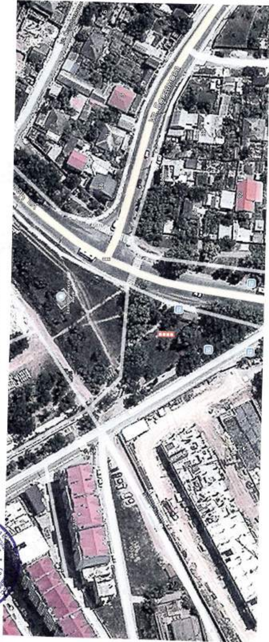
г. Севастополь, парк Учкучевка